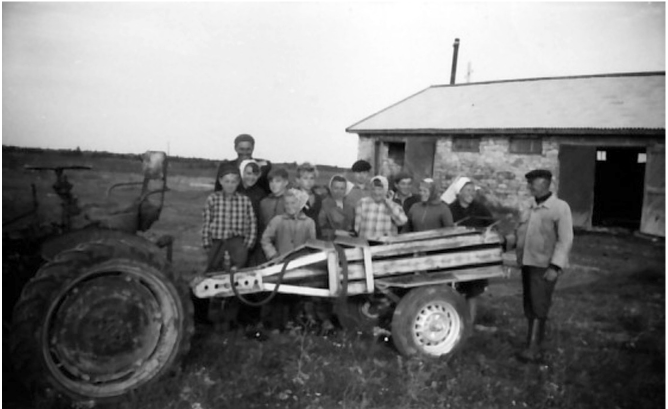
Fotol Tibari kirst

heks. Küllap selleks, et mõlemalt sillapoolelt saaks laadimistööd teha. Sellel oli väike lahtine platvorm veeremiks. Sõitsime sellel vahetevahel, andsime hoogu ja alla sillale välja. Põllo lastele oli asi selge, aga meile oli see natuke hirmutav, kas saabki pidama. Meie vanemad ei tahtnud, et sellega sõidame, sest raudtee tuli üle suure tee, kus oli ikka liiklust.