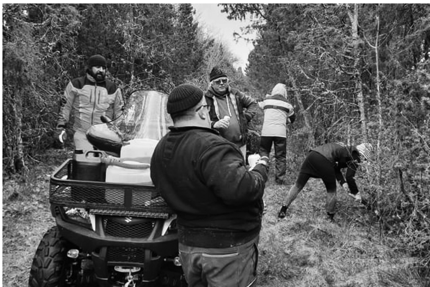
Orjaku kevadtalgud loodusrajal