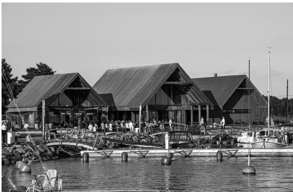
Orjaku sadama kolm õde: info-, saali- ja saunamaja

Kas selleni jõutakse juba alanud hooajal või veidi hiljem, näitab aeg, igatahes jääme põnevusega ootama. Siinkohal suured tänud Orjaku küla Porgi talu perele, kes linnutorni uksi iga päev avas ja sulges, et kõik huvilised saaksid näitusega tutvuda.