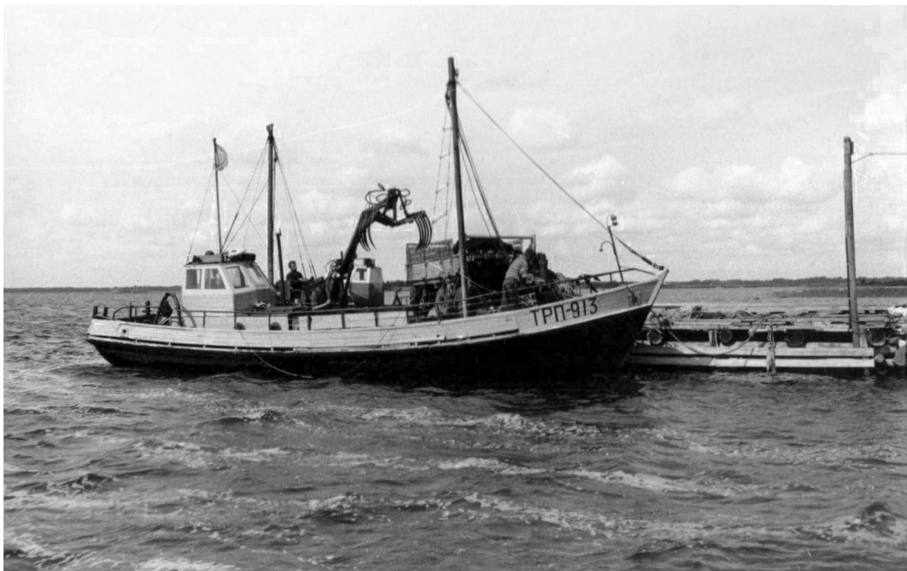
Vetika püüupaat, mis sügisel läks lestapüügile

Orjaku sadama kaudu varsti enam palke välja ei veetud. Laoplatsidelt viidi puumaterjal ära, raudtee võeti üles ja tühjad platsid võeti kuivatusplatsideks. Sellega oli palju tööd. Tuli riisuda kokku ja põletada kõik see mis palkide küljest varisenud. Koorepraht, pilpad, oksatükid, puunotid, seda oli palju ja laialt ja tööd kõvasti. Sama „valge maja“ lähedal oli estakaad mattunud üsna puuprahi alla. Seda me lahti ei võtnud. Las kõduneb. Aga ühel kevadel, kui hakkasime jälle maad kulust puhtaks põletama (seda tegime puhta toodangu saamiseks igal kevadel), läks tuli käest ja pääses sinna. See oli päris hirmutav. Saime lõpuks tule igalt poolt ümberringi kinni. Aga sinna keskele, kuhugi sügavusse ta jäi. Suvel nägime vahel vaikset suitsu immitsemas siit ja sealt. Ju see puukõdu hoidis mingil kombel tuld hõõgumas. Kustutasime, aga lõplikult kustus alles järgmisel kevadel kui lumi sulas. Talvel käisid isa ja ema seda mitu korda vaatamas. Ütlesid, et ikka jälle on augud lumme sulanud. Kusagil oli ikka veel tuli.