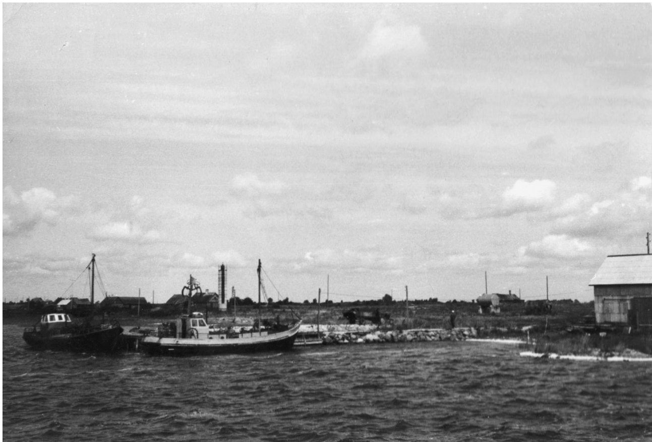
Orjaku sadam, 1970-ndad.

Vurtsuplatsid muutusid ehitusplatsideks ja tekkinud on ehk uus hiidlaste selts „merejõllajad“ . . .