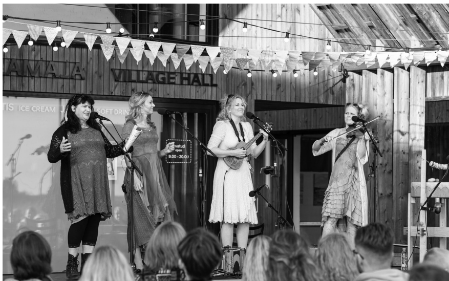
Naised Köögis kontsert.

Suvi Kassaris & Kassari Kultuurineljapäevade kaheksas hooaeg toimus 20. maist kuni 16. septembrini ja oli sisult veidi teistmoodi nii sündmuste rohkuse kui toimumiskohtade poolest – jätkasid nii varasemad partnerid kui lisandusid uued ja teistmoodi osalised. Uudsenäid said meie programmi osadeks ka neli üleriigilist kontsert-tuuri, kus Orjaku sadamas astusid üles ansamblid JÄÄÄÄR, Naised Köögis, C-JAM ning armastatud lauljad Tõnis Mägi ja Ott Lepland. Viimaste kontsert oli Orjaku sadama kõigi aegade kõige suurem kontsert, kus osales üle viiesaja kuulaja. Sellist tuuride rohkust pole varasemalt Kassaris olnud ja üks aeg näitab, kas tuleb ka edaspidi.