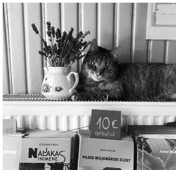
Rahvamaja kass Findus poevalves