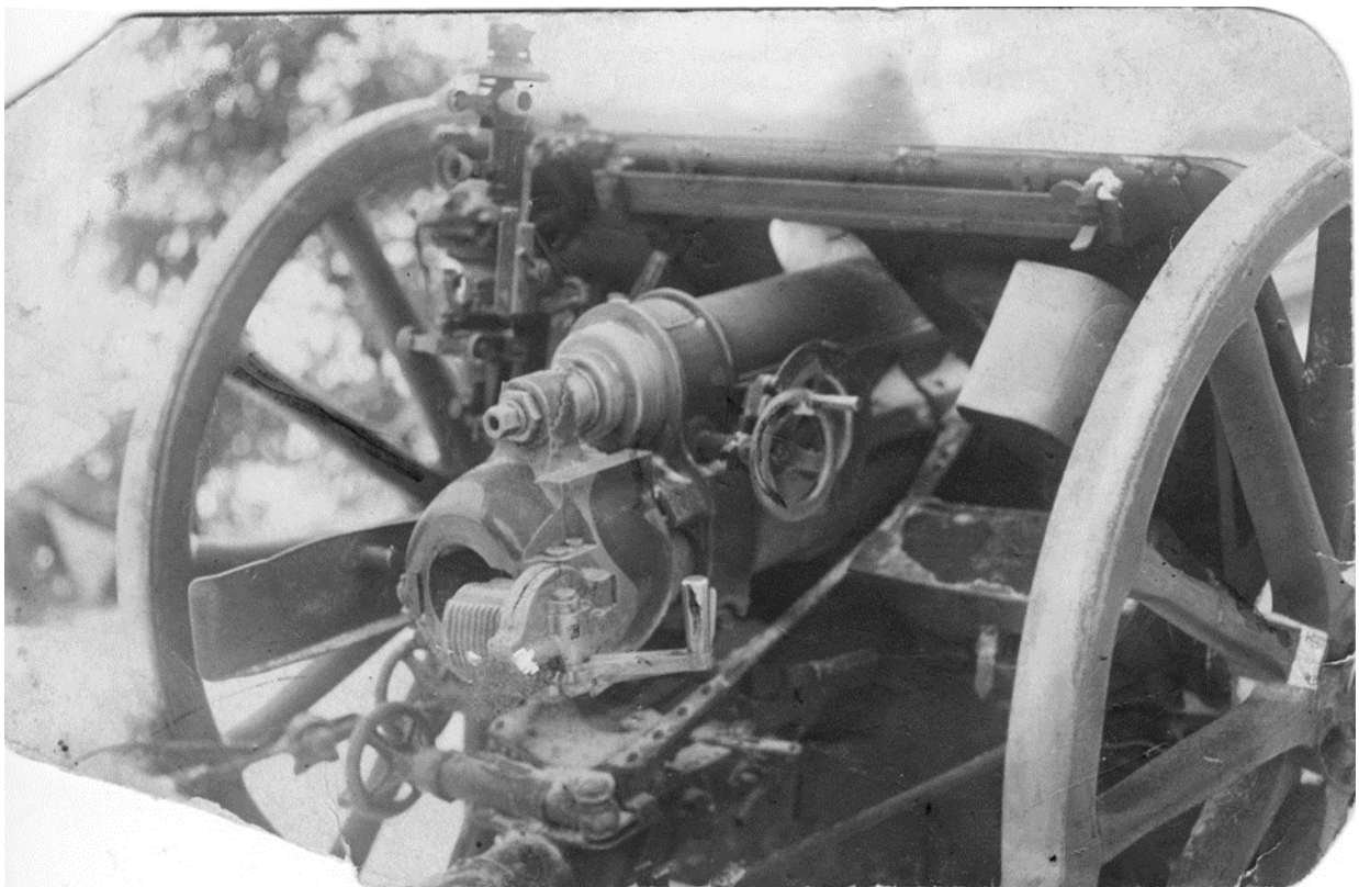
Vabadussõja kahur. Norgani kogu.